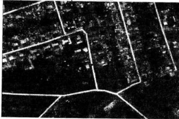
Рисунок 1. Ситуационный план участка работ

Сейсмичность района изысканий равна 6 баллам.